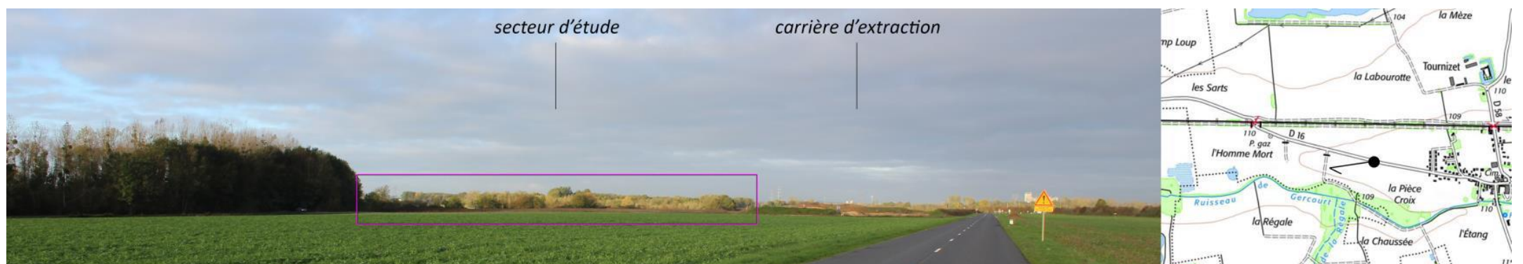
Figure 2 : Une perception du site limitée à une faible portion de la RD16

Ainsi, une frange arborée récurrente s'imisce dans le champ visuel, masquant concrètement la zone d'implantation aux regards.