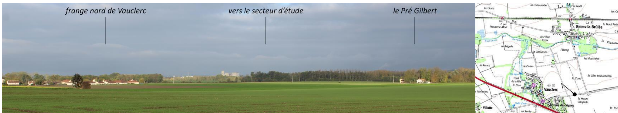
Figure 1 : Une absence d'interactions avec les édifices protégés proches (Vauclerc)

Les seules visibilité sur le projet ont lieu depuis la route départementale D16 en sortie de Reims-la-Brûlées.